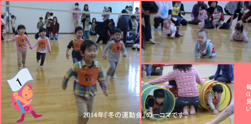
2014年『冬の運動会』の一コマです。