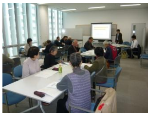
地域活動交流会の様子

しています。活動資金となる助成金の相談、活動団体の交流・情報交換のための団体交流会の開催、情報誌「かだる」の発行、セミナーの開催、ホームページからの情報提供など様々な事業を行っています。地域での社会参加に意欲を持つ高齢者の皆さんのご利用をお待ちしています。