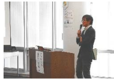
当日の講演の様子

およそ1時間の講演でしたが、参加されたみなさまは非常に熱心に講演に聞き入り、参考にされているようでした。