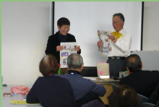
平成29年12月5日に開催した アクティブ・シニア交流会の様子