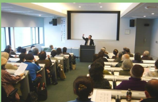
昨年度の「いきいきシニアセミナー」の様子 （「読書を通じたシニアの心豊かな生活」）